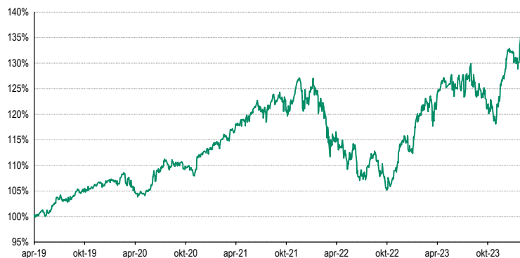
Gegevens bepaald op 1 februari 2024

Deze waarderingen zijn enkel indicatief en uitgedrukt in MID, d.w.z. het gemiddelde tussen de biedprijs en de laatprijs.