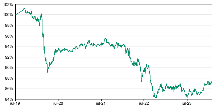
Gegevens bepaald op 1 februari 2024

Deze waarderingen zijn enkel indicatief en uitgedrukt in MID, d.w.z. het gemiddelde tussen de biedprijs en de laatprijs.