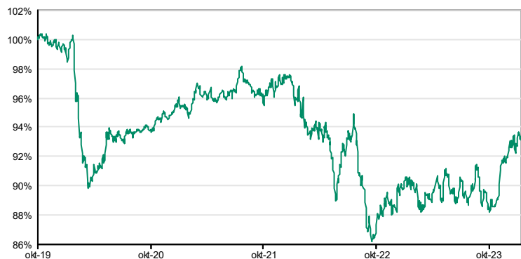
Gegevens bepaald op 1 februari 2024

Deze waarderingen zijn enkel indicatief en uitgedrukt in MID, d.w.z. het gemiddelde tussen de biedprijs en de laatprijs.