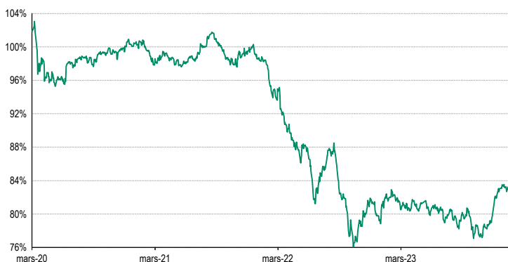
Données arrêtées au 1 février 2024

Ces valorisations ne sont qu'indicatives et sont exprimées en MID, c'est-à-dire la moyenne entre le prix offert et le prix demandé.