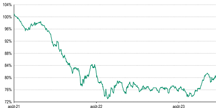
Données arrêtées au 1 février 2024

Ces valorisations ne sont qu'indicatives et sont exprimées en MID, c'est-à-dire la moyenne entre le prix offert et le prix demandé.